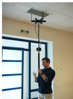
Utilización con la rejilla de medición