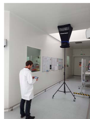
Utilización con el Trípode telescópico