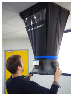
Colocación del caudalímetro