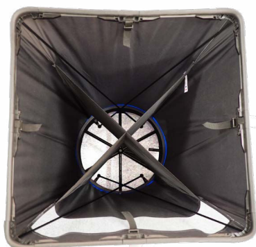
Campana con rectificador de flujo