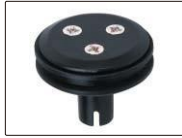
rueda con perímetro de 0,1 m (incluida)